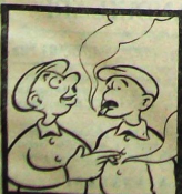
— Bizim meclis giren işçi kanunları bana şöyle bir şey hatırladı: