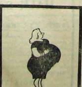
— Kadının biri gebe kalıyor.