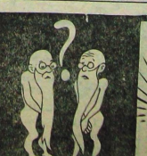
— Nihayet iki çocuk doğuyor.