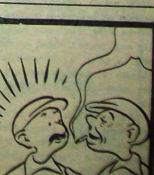
— Nedensiz çocuklar baba rahminden birbirlerini top ritafı yapıyor. Kurban birinin kanununda 8 öykün sonra düşecek.