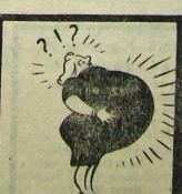
— Aylar yılı ar geçiyor, bir türlü doğum yok.